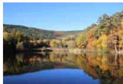
Sankt Martiner Weiher