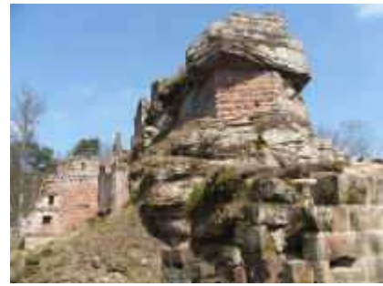
Burgruine Schöneck von Süden

Familie der Sauergrasgewächse, die zu den skurrilsten