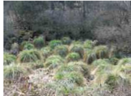
Seggengewächse im Winecker Tal