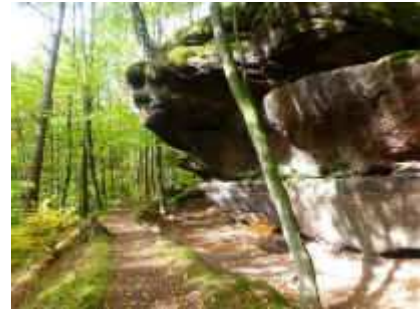
Einer der typischen Felsen-Rastplätze