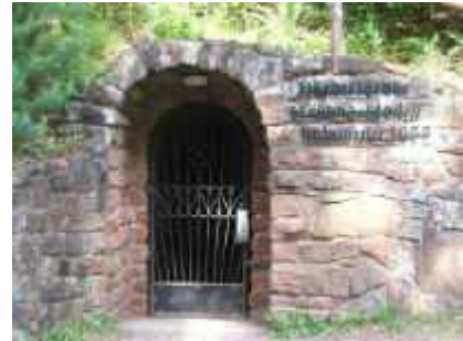
Eingang des Sankt-Anna-Stollens