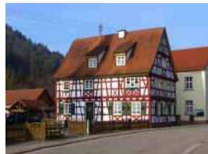
Fachwerkhaus in Bobenthal