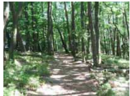
Auf dem Hüttenberg