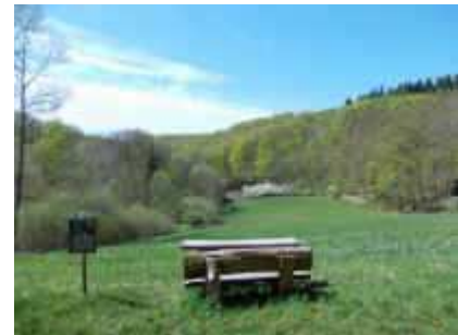
Rastplatz in der Nähe des Hintersteiner Hofes