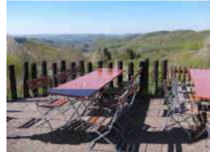
Die Aussichtsterrasse des Falkensteiner Hofes