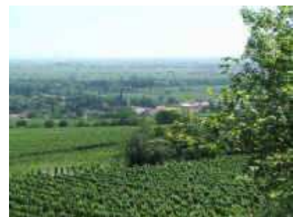
Wanderweg Deutsche Weinstraße