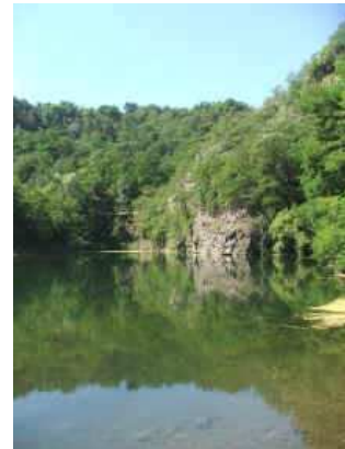
See im Forster Basaltsteinbruch