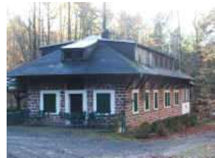
Waldhaus Drei Buchen