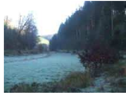
Im vierten Seitental der Wolfslöcher