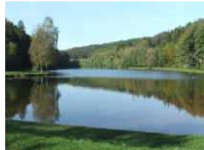
Etang de Fleckenstein