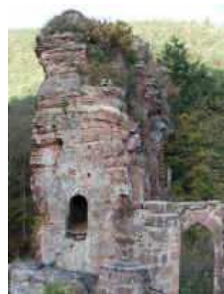
Auf der Froensburg