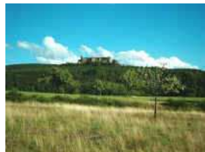
Burgruine Fleckenstein von Norden