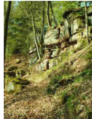
An der Heidelsburg