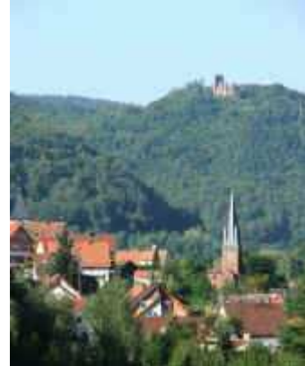
Dernbach mit der Ramburg