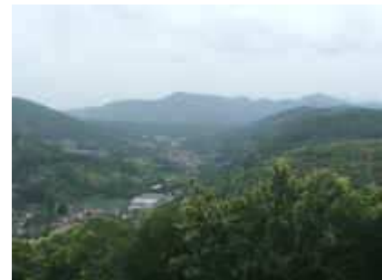
Von der Ramburg ins Trifelsland