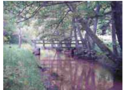
Über die Rodalberbrücke