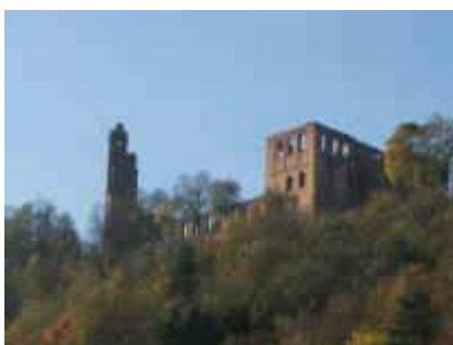
Klosterruine Limburg bei Bad Dürkheim