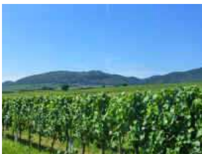
An der Deutschen Weinstraße