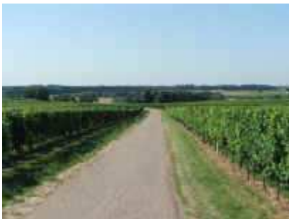
Aus den Weinbergen zum Bienwald