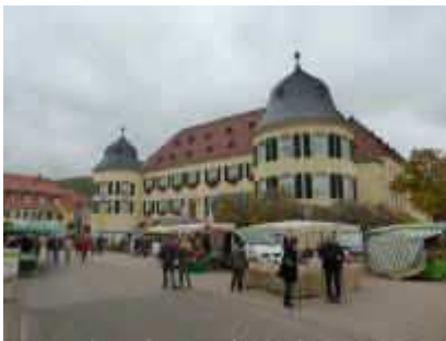
Das Bad Bergzaberner Schloss