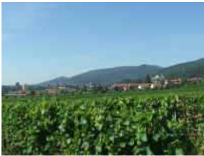
Neustadt an der Weinstraße vor den Kalmit-Bergen

Aus dem Pfälzerwald zu den Zentren der Kurpfalz