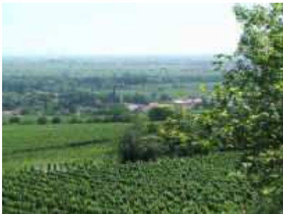
Blick über Deidesheim in die Rheinebene