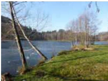
Schöntalweiher bei Ludwigswinkel