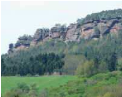
Hochstein-Massiv aus dem Wieslautertal