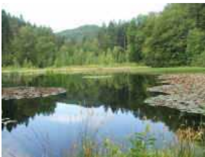
Kranzwoog im Moosalbtal