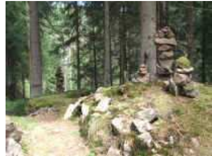
Zustieg zum Grauhansenfelsen