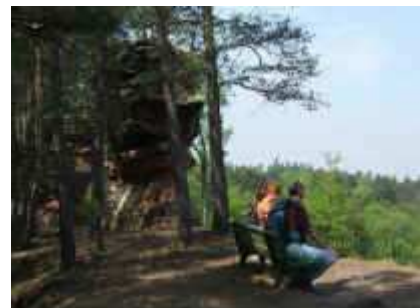
Rast auf dem Lämmerfelsen