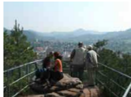
Auf dem Sängerfelsen